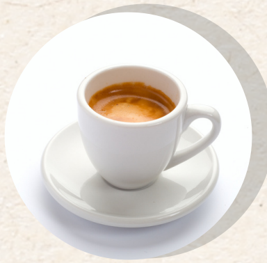
Espresso 3,30 €