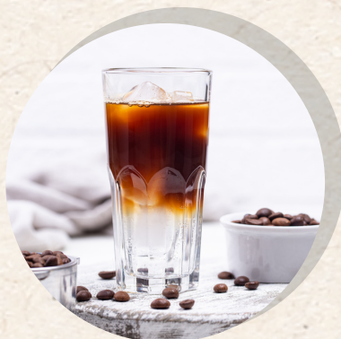
Espresso Tonic 4,80 €