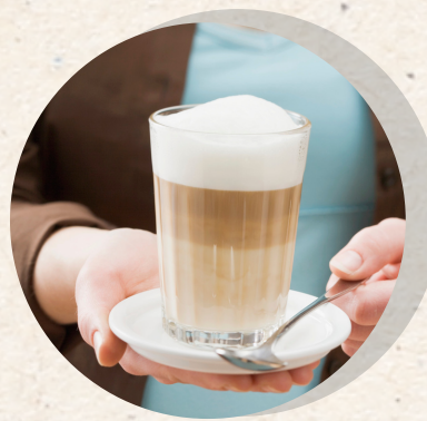
Latte macchaito 4,80 €