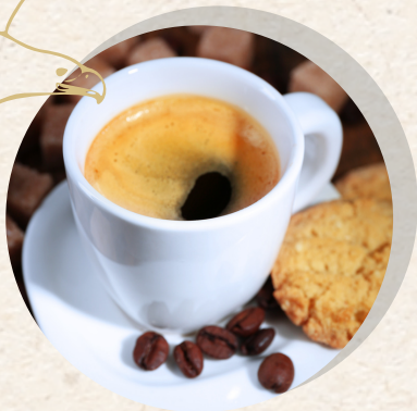
Tasse Kaffee 3,30 €