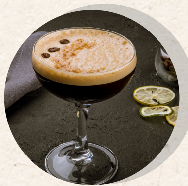
Espresso Martini 9,00 €