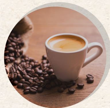
Espresso doppio 4,80 €