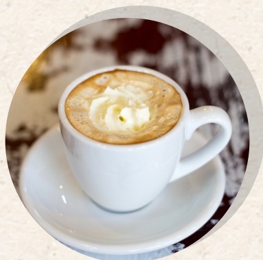
Espresso macchiato 3,30 €