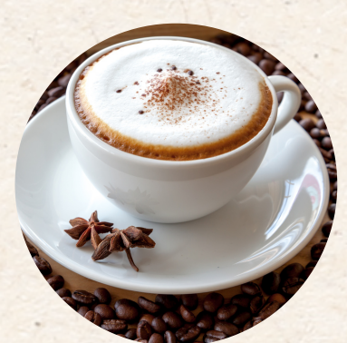
Cappuccino 3,80 €